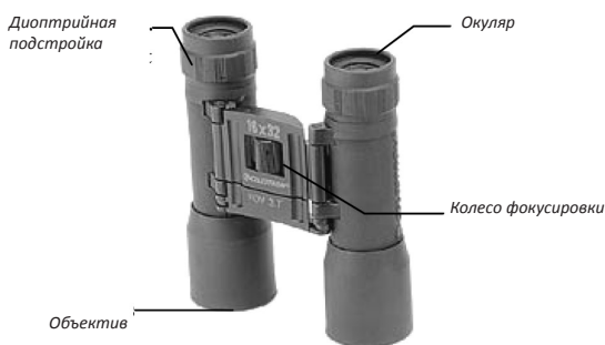
Бинокль на призмах Порро (Porro)

Некоторые бинокли с большим диаметром объективов имеют встроенный штативный адаптер, являющийся частью жесткой перекладки бинокля, который может быть напрямую присоединен к стандартному фотографическому штативу.