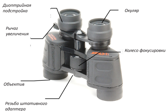
Бинокль на призмах с крышей (Roof)